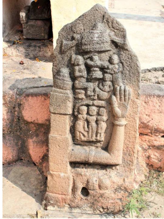
चित्र क्र. १. : सतीशिळा, न्हावीसांडस, पुणेजिल्हा.