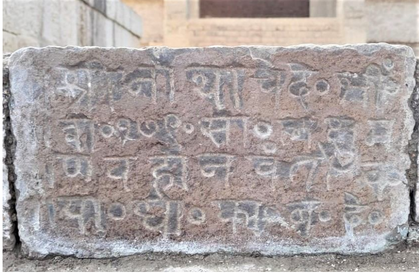
चित्र क्र. ४. श्रीनाथमंदिरातील शिलालेख, सांगवीसांडस, पुणेजिल्हा