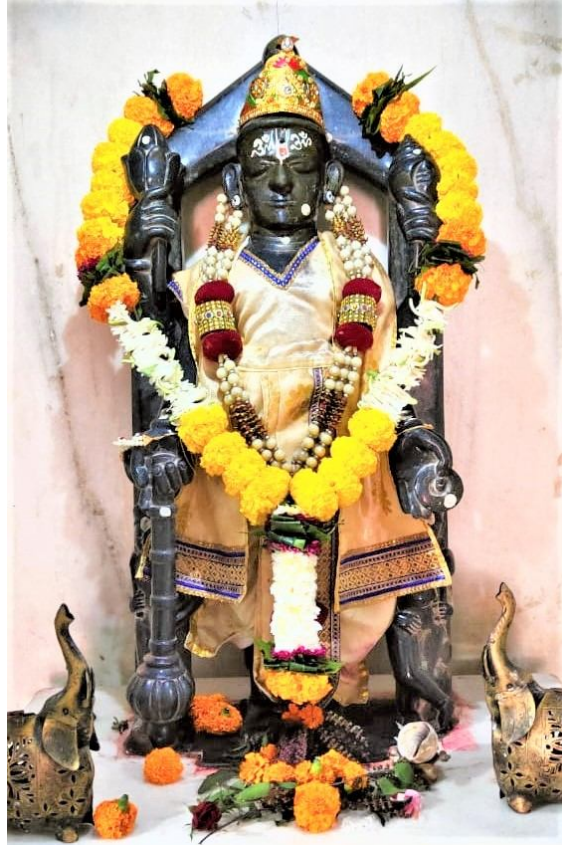
चित्र क्र. ३. विष्णूमंदिरातीलविष्णूशिल्प, सांगवीसांडस, पुणेजिल्हा.