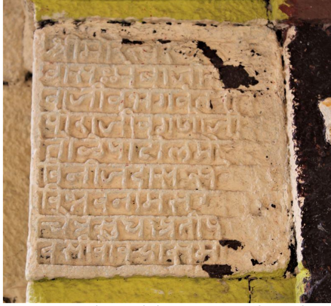
चित्र क्र. २. न्हावी-सांडस येथील अप्रकाशित मराठी शिलालेख