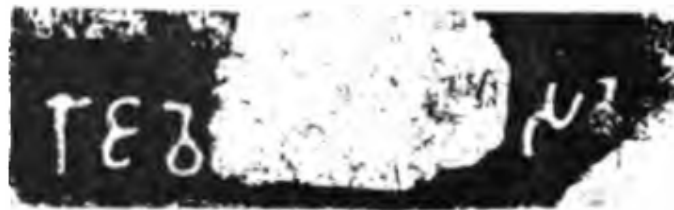
राजवे -----स (भग्न)