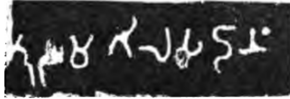
(भग्न) .... तुस मगिलस दानं