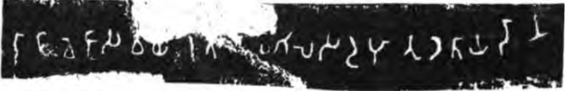
राजवेजस वछिपुतस मगिलस दहुतु दताय दानं