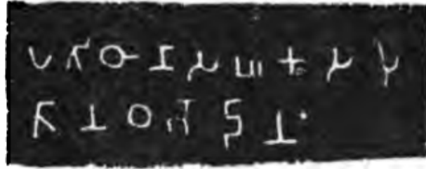
पतिठाणा सघकस पुतान थबो दानं

गुंफा क्र. ५ समोर पडलेल्या एका दगडावर एक खंडित लेख आहे त्यानून फारसा अर्थबोध होत नाही. [...यठ अथिसेनिया] ठिसूळ दगडामुळे पितळखोरे येथील लेण्यांची बांधणीपश्चातच पडझड सुरु झाली होती हे येथील प्राचीन काळातील जीर्णोद्धारारवरून दिसून येते. तशातच चैत्य लेणे क्र. ३ आणि लेणे क्र. ४ येथील स्तंभांची बरीच पडझड झाली आहे. त्यामुळे अजूनही काही शिलालेख नष्ट झाल्याची शक्यता आहे.