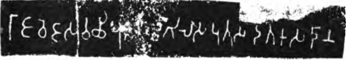
राजवेजस वछिपुतस मगिलस पुतस दतकस दानं (यथादृष्ट प्रती-Burgess James and Indrajī Bhagwanlal, Inscriptions from the Cave Temples of Western India)