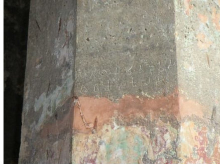
पतिठाणा मितदेवस गाधिकस कुलस (थभो) दानं