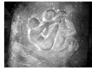
छा.चि.क्र. ३ कामशिल्प, कोळे