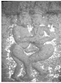
छा.चि.क्र. १ कामशिल्प, कोळे

निष्कर्ष :- सोलापूर जिल्ह्यात महादेव मंदिर कोळे ता.सांगोला, कलिपसिध्द मल्लिकार्जून मंदिर भुईकोट किल्ला, सोलापूर, मल्लिकार्जून मंदिर, चपळगांव, महादेव मंदिर, कासेगांव येथील मंदिरावर कामशिल्पे व मैथुन शिल्पे कोरली आहेत. या शिल्पांवरून असे वाटते की, प्राचीन भारतीय तत्त्वचिंता आणि धार्मिक कर्मकांड यात गडलेले असले, तरी लौकिक जीवनाकडे त्यांनी पाठ फिरवली नव्हती. ते सुद्धा जगातील इतर देशांतील लोकांप्रमाणे ऐहिक सुख समाधानासंबंधी जागृत होते. परंतू त्यांचा ऐहिक सुखाकडे पाहण्याचा दृष्टीकोन भिन्न होता असे समजते.