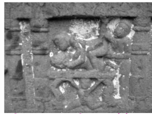
छा.चि.क्र. २ कामशिल्प, कोळे