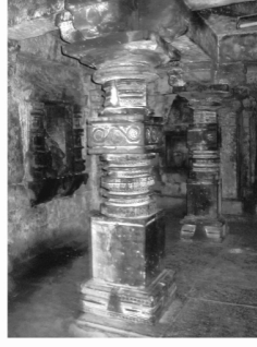
छा.चि.क्र. ५ कामशिल्प, कोळे