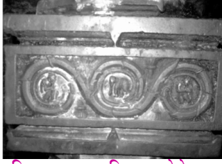
छा.चि.क्र. ४ कामशिल्प, कोळे